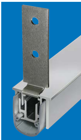
Planet RS, Dichtungslänge optimiert mit Haltewinkel 4 mm, gekröpft