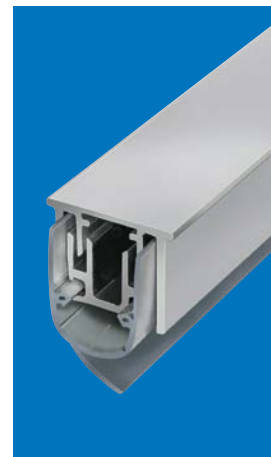
Option: Planet RS Schräglippe für wellige Böden