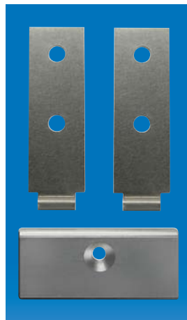
Beispiel: Haltewinkel VEKA inkl. Auflaufplatte Typ 10 aus Montageset RS / Typ VEKA