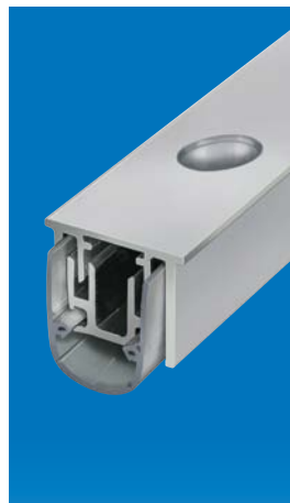
Option: Planet RS mit Planet Bohrung Ø 10,8 mm und 5×13 mm. Siehe Kapitel Kantriegel | Bohrung