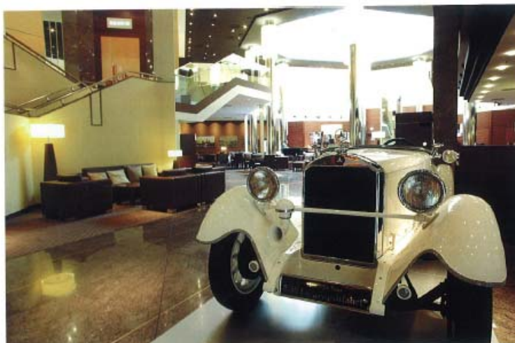
Empfangshalle des Westin Grand Hotels in Frankfurt/Main

Der nachträgliche Einbau im Westin Grand Hotel betraf sowohl ein- und zwei-