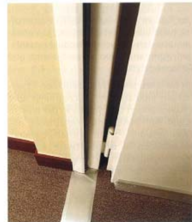
Zargendichtung „SRS-3“, „SD-1“ mit „SRS-3-Clips“ und Bodendichtung „Planet FT“

Rauch- und Dauerfunktionsprüfungen an alten Türen unterschiedlicher Bauart unterzogen. Das Ergebnis: Alle mit dem System ausgestatteten Türen entsprachen den Anforderungen der DIN 10 995. Die Prüfzeugnisse und Gutachten des Materialprüfungsamtes Nordrhein-Westfalen bestätigen, dass die nachgerüsteten Türen die Anforderungen der DIN 18 095 technisch erfüllen.