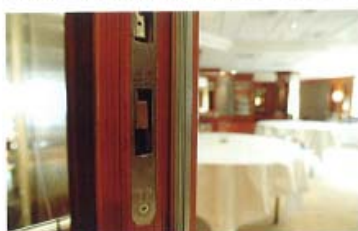
Mittelfalzdichtung „SD-2“ an einer Holztür

flügelige Stahltüren, als auch Holztüren. Hier bewährte sich, dass sich das Nachrüst-Rauchschutzsystem von „System Schröders“ für viele Türtypen eignet.