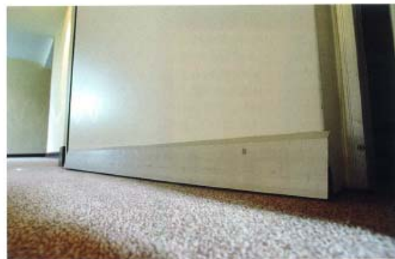
Bodendichtung „Planet FT“ und Mittelfalzdichtung „MK-AL“ und „SD-2“

Die umlaufenden Nachrüstdichtungen von „System Schröders“ wurden vom Materialprüfungsamt Nordrhein-Westfalen eingehenden