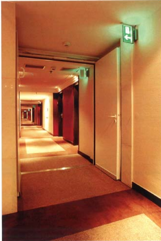
Nachgerüstete Feuerschutztüren auf einem Flur des Hotels

Um die Sicherheit in einem Brandfall zu erhöhen, setzt das Frankfurter Westin Grand Hotel auf das Nachrüst-Rauchschutzsystem von „System Schröders“ aus Erkelenz.