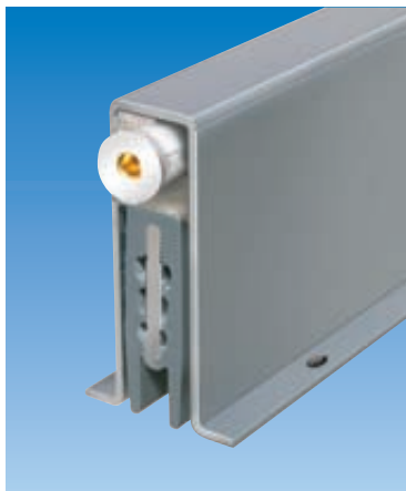
Planet N mit Auslöseknopf