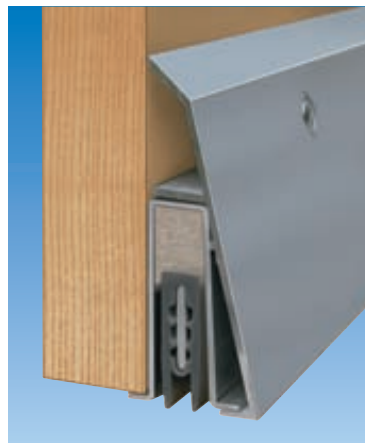
Planet N mit Planet Sockel