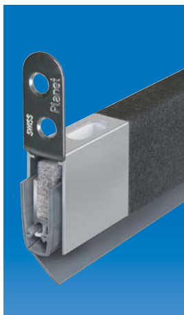
Option: Planet MinE-V mit Planet Bohrung 5×13 mm