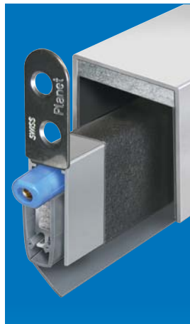
Planet MinE-V mit Haltewinkel, Kanal und Dämmung