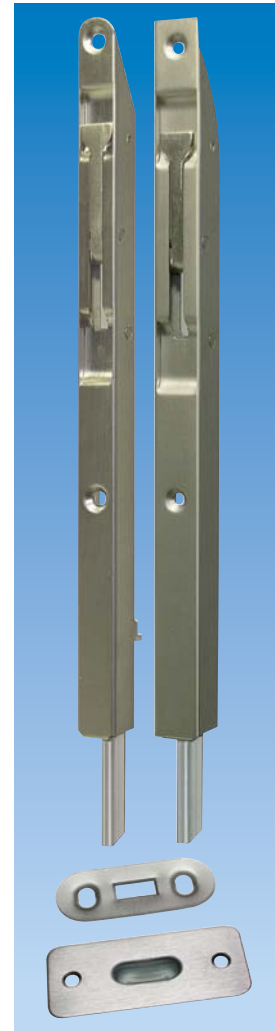
Planet KR Kantriegel, inkl. Schliessblech, siehe Kapitel Kantriegel | Bohrung. Option: Bodenmulde 5×13 mm schmal