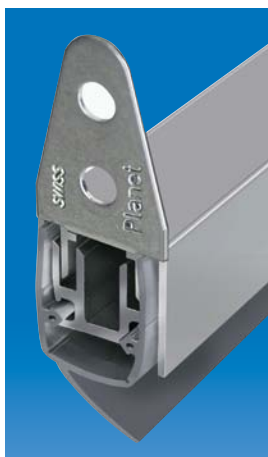
Option: Planet MF Schrägrippe für wellige Böden