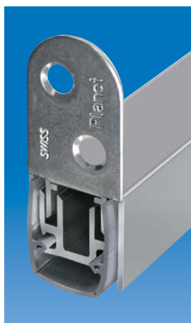
Option: Planet MF mit Halte- winkel für Holztüren