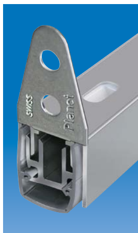
Option: Planet MF mit Planet Bohrung 5×13 mm