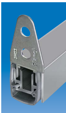
Planet MF mit Halte- winkel für Metalltüren