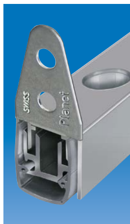
Option: Planet MF mit Planet Bohrung Ø 10,8 mm