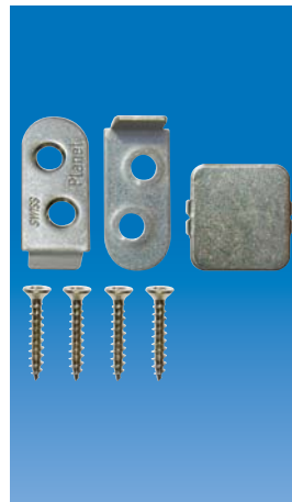
Planet Montageset HS