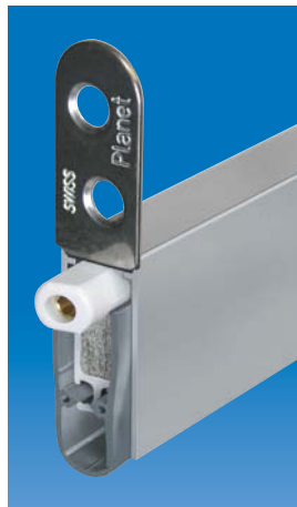
Planet HS mit Haltewinkel, Auslösesseite