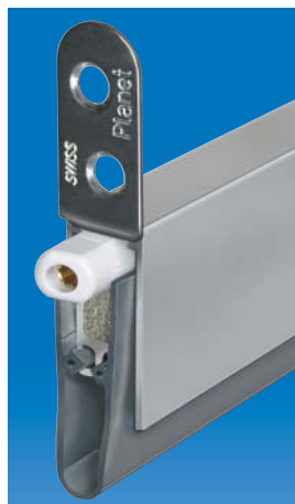
Option: Planet HS+8 mit Haltewinkel, Auslösesseite