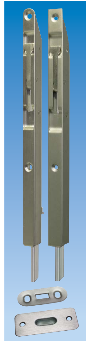
Planet KR Kantriegel, inkl. Schliessblech, siehe Kapitel Kantriegel | Bohrung. Option: Bodenmulde 5×13 mm schmal