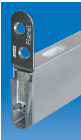
Option: Planet HS mit Planet Bohrung 5×13 mm