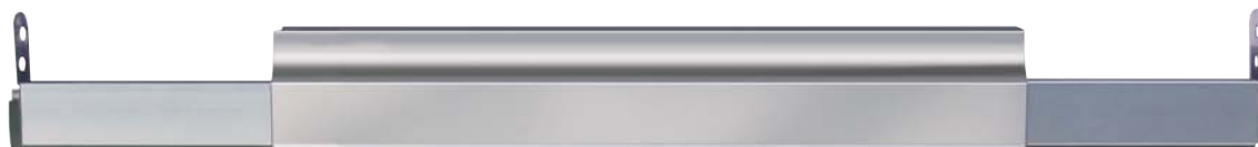
Planet KG-F8 Absenktdichtung und Planet KG-F8-Schutzprofil