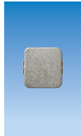
Planet Auflaufplättchen Typ 1, Inox, 20×20 mm